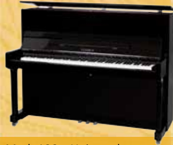
Mod. 122 - Universal