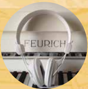
Silenciador para todos los modelos