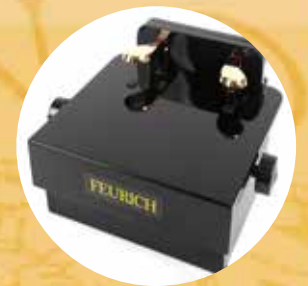
Extensión de los pedales

Desde hace más de 160 años los pianos FEURICH entusiasman al mundo musical. En ellos convergen ahora la construcción tradicional y la innovación en la más moderna producción de pianos. Para más información, visítennos en www.feurich.com