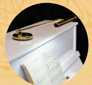
Lámparas para piano

Desde hace más de 160 años los pianos FEURICH entusiasman al mundo musical. En ellos convergen ahora la construcción tradicional y la innovación en la más moderna producción de pianos. Para más información, visítennos en www.feurich.com