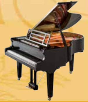
Mod. 179 - Dynamic II