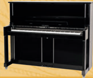
Mod. 125 - Design