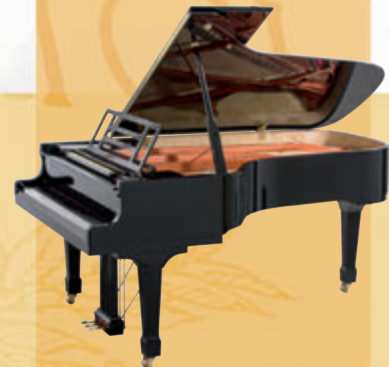
Mod. 218 - Concert I