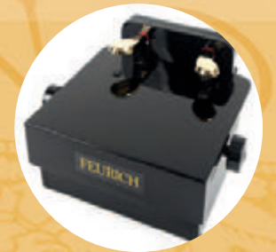
Réhausseur de pédales

Avec ses instruments, FEURICH enchante le monde entier depuis plus de 160 ans. Nous savons allier facture instrumentale traditionnelle, innovations, et une production de pianos à la pointe de la modernité. Rendez nous visite sur feurich.com