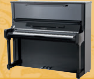
Mod. 133 - Concert