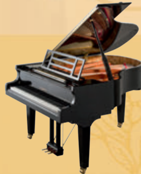
Mod. 179 - Dynamic II