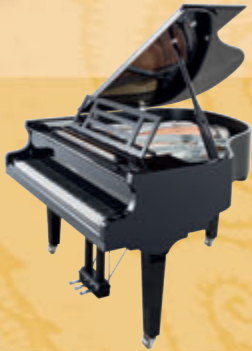
Mod. 162 - Dynamic I