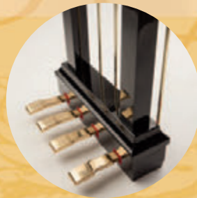
Pédale harmonique pour les pianos à queues