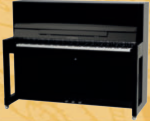
Mod. 115 - Premiere