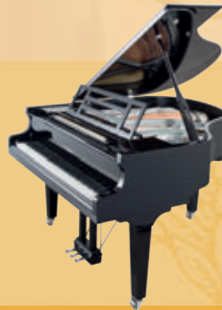
Mod. 162 - Dynamic I