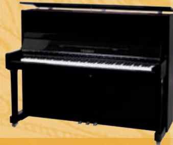
Mod. 122 - Universal