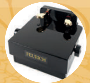
Réhausseur de pédales

Avec ses instruments, FEURICH enchante le monde entier depuis plus de 160 ans. Nous savons allier facture instrumentale traditionnelle, innovations, et une production de pianos à la pointe de la modernité. Rendez nous visite sur feurich.com