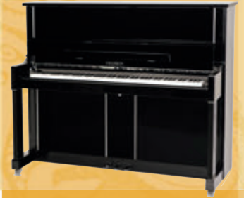
Mod. 125 - Design